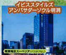
イビスタイルズアンバサダーソウル明洞