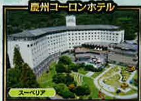
会津コーロンホテル