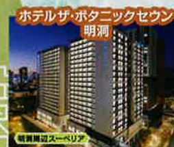
ホテルザ・ポタニックセウ