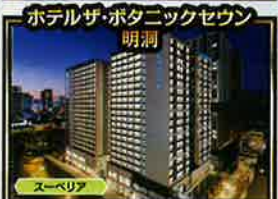
ホテルザ・ポタニックセウ