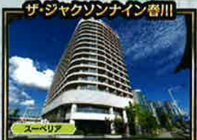
ザ・ジャクソンイン会津